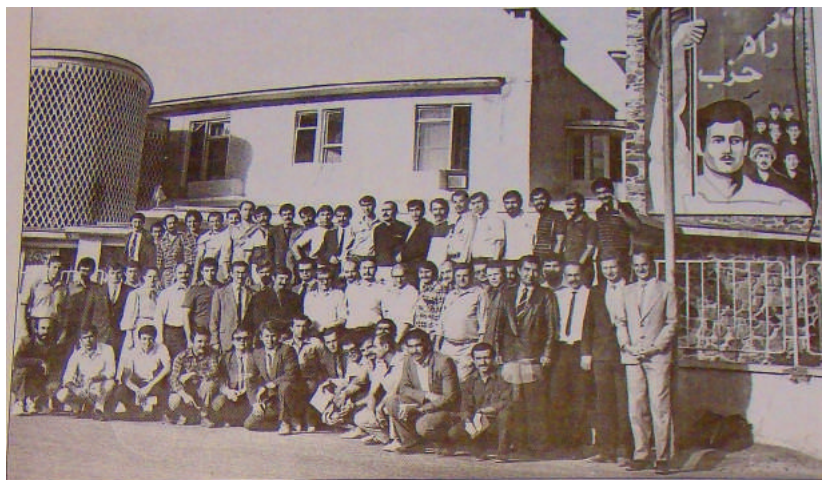
Советники и переводчики у здания ЦК ДОМА, октябрь 1986 г.